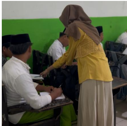
Gambar 4. Pendampingan berupa

Salah satu bentuk pendampingan Mahasiswa terhadap siswa yang memberikan kontribusi penuh terhadap siswa yang kurang aktif atau mengalami kesulitan dalam memahami materi. Kegiatan pendekatan personal dan bimbingan individual ini menjadi penting agar siswa lebih semangat dalam menangkap penjelasan yang mudah, guna memudahkan siswa untuk memahami pelajaran yang belum dimengerti dengan menjelaskan ulang dengan penjelasan yang mudah dimengerti.