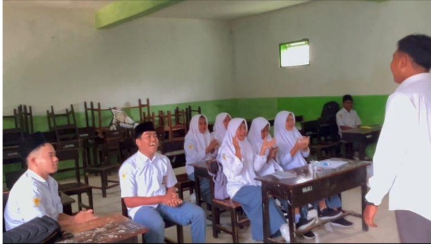
Gambar 3. Siswa yang Melakukan Ice Breaking

Syaiful Bahri 1 , Maulidatun Nabilah 2 , Achmad Nur Fawaid 3 , Moh Nuril Anwari 4 , Sova Abrori 5 , Muhammad Najibul Khoir 6 , Ach Noval Akbar 7