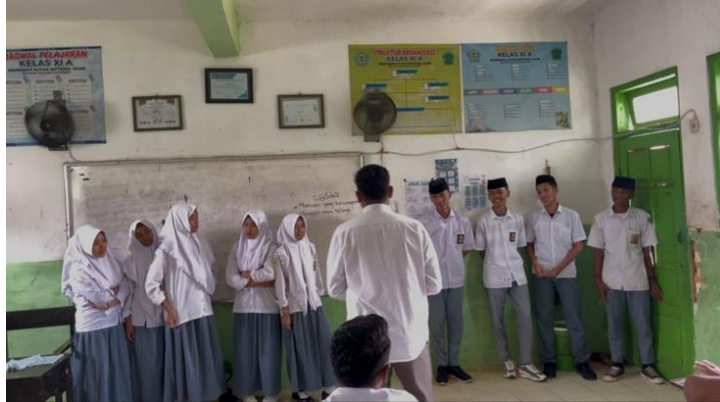
Gambar 2. Pendampingan Diskusi Kelompok dengan Siswa

Syaiful Bahri 1 , Maulidatun Nabilah 2 , Achmad Nur Fawaid 3 , Moh Nuril Anwari 4 , Sova Abrori 5 , Muhammad Najibul Khoir 6 , Ach Noval Akbar 7