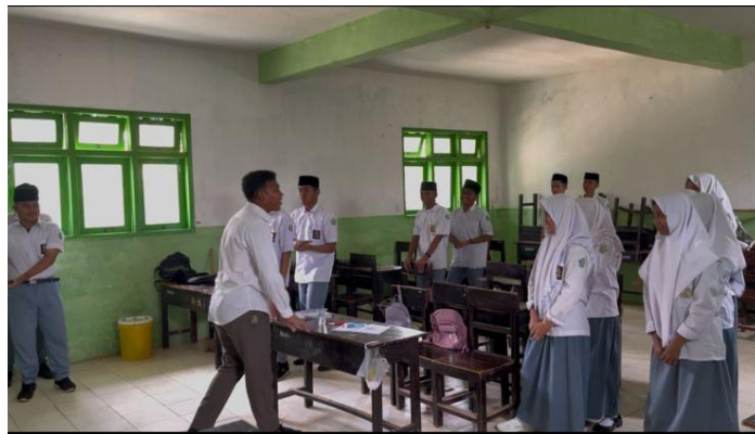
Gambar 1. Pendampingan Mengidentifikasi Masalah dengan Siswa

Penerapan PBL diawali dengan pemberian permasalahan kontekstual yang berkaitan dengan materi pembelajaran. Masalah tersebut mendorong siswa untuk berpikir lebih mendalam dan mencari solusi secara mandiri maupun melalui diskusi kelompok. Pada tahap ini, siswa mulai menunjukkan peningkatan rasa ingin tahu, yang terlihat dari munculnya berbagai pertanyaan terkait permasalahan yang diberikan.