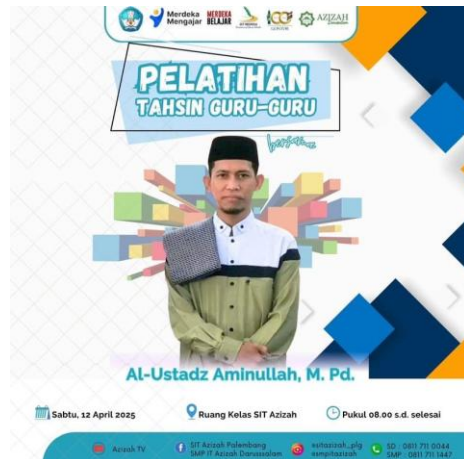
Gambar 9: Pelatihan Tahsin guru-guru di SMP IT Azizah Darussalam Palembang