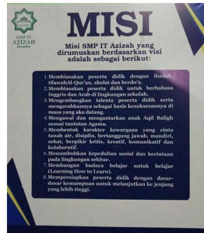
Gambar 2 Misi SMP IT Azizah Darussalam Palembang