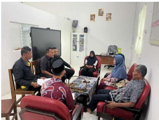
Gambar 3: Evaluasi (dipanggilnya guru lama, bendahara, ssekretaris, CS, oleh BPH)

Gambar tersebut menunjukkan visi misi sekolah, data evaluasi tenaga pendidik, serta pemanggilan guru oleh BPH yayasan, jadi perencanaan kebutuhan guru dan tenaga kependidikan di SMP IT Azizah Darussalam Palembang dilakukan secara terstruktur dan selaras dengan visi misi sekolah. Dokumentasi tersebut juga menunjukkan adanya evaluasi aktif terhadap kinerja, kontrak kerja, dan kebutuhan tenaga pendidik secara berkelanjutan..