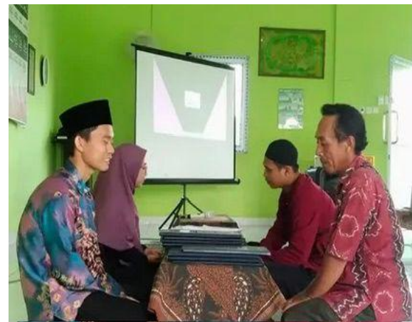
Gambar 5: Wawancara calon guru di SMP IT Azizah Darussalam Palembang