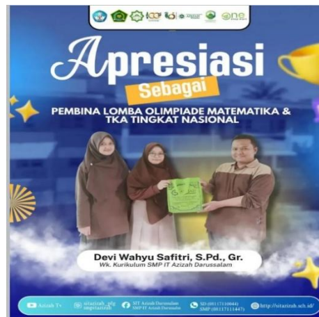
Gambar 14: Pemberian Reward Guru SMP IT Azizah Darussalam

Gambar tersebut menunjukkan adanya pengawasan kinerja guru melalui supervisi langsung di kelas oleh tim khusus yang menilai penguasaan materi, pengelolaan kelas, dan proses pembelajaran, serta pemberian apresiasi kepada guru berprestasi sebagai bentuk motivasi. Dengan demikian, pengawasan dan evaluasi SDM di SMP IT Azizah Darussalam Palembang berjalan baik dalam meningkatkan kualitas dan profesionalisme tenaga pendidik.