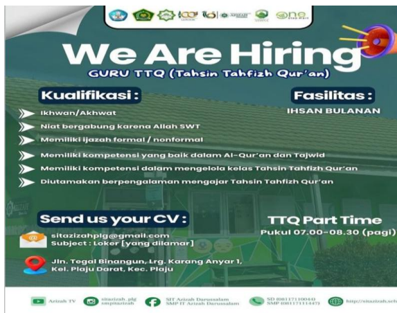
Gambar 4: Kualifikasi Rekrutmen Guru TTQ di SMP IT Azizah Darussalam Palembang

Dokumentasi pada gambar 4,5,6 dan 7 berupa struktur organisasi, data tenaga pendidik, dan kualifikasi rekrutmen di SMP IT Azizah Darussalam Palembang menunjukkan adanya pembagian tugas, penempatan guru sesuai bidang keahlian, serta sistem rekrutmen yang mempertimbangkan kompetensi akademik dan nilai-nilai keislaman.