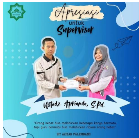
Gambar 12: Pemberian Reward guru di SMP IT Azizah Darussalam Palembang