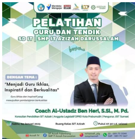
Gambar 8: Pelatihan guru & tendik di SMP IT Azizah Darussalam Palembang