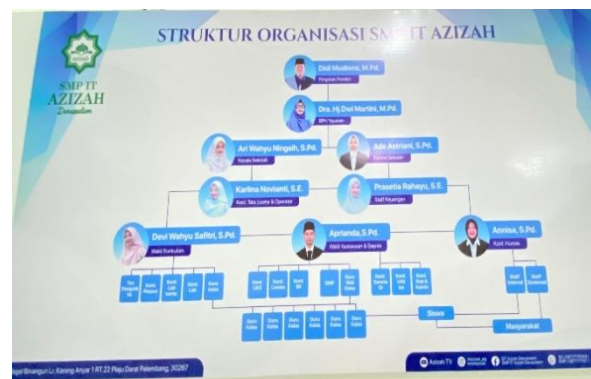
Gambar 7: Struktur Organisasi SMP IT Azizah Darussalam Palembang

Gambar tersebut menunjukkan bahwa setiap tenaga pendidik memiliki tugas dan tanggung jawab yang jelas sesuai bidangnya sehingga kegiatan sekolah berjalan tertib dan terarah. Hal ini diperkuat oleh wawancara dan observasi yang menunjukkan proses seleksi guru melalui