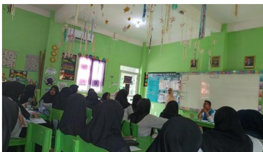
Gambar 10: Darussal Islamiyah (siraman Rohani keislaman) Rapat dan evaluasi di setiap hari jum'at

Gambar tersebut menunjukkan adanya adanya program pembinaan kompetensi guru baik dalam aspek profesional maupun keislaman sebagai bentuk pengembangan kualitas tenaga pendidik di SMP IT Azizah Darussalam Palembang. Sekolah rutin melaksanakan pelatihan mengajar, pembinaan Al-Qur'an, munaqsyah hafalan, serta kegiatan evaluasi dan siraman rohani setiap hari Jumat. Hal ini juga terlihat dari keterlibatan langsung guru dalam kegiatan pembinaan dan pelatihan yang dilaksanakan sekolah. Dengan demikian, pelaksanaan manajemen sumber daya manusia di SMP IT Azizah Darussalam Palembang berjalan dengan baik dan mendukung peningkatan mutu pendidikan melalui pengembangan kompetensi dan nilai-nilai keislaman tenaga pendidik.