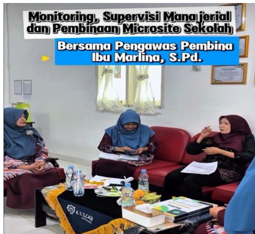
Gambar 11: Supervisi guru & tendik di SMP IT Azizah Darussalam Palembang