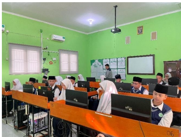
Gambar 13: Proses Supervisi Pengajar SMP IT Azizah Darussalam