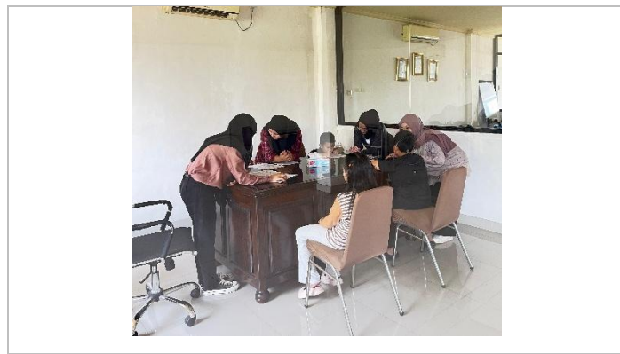
Gambar 4. Asesmen Psikologi

Selain itu, tes grafis seperti DAP, Baum, dan HTP digunakan sebagai pelengkap untuk melihat kondisi emosional anak melalui ekspresi gambar. Hasil tes grafis menunjukkan adanya perbedaan cara anak mengekspresikan perasaan dan pengalaman mereka, yang tidak selalu terlihat melalui tes tertulis. Secara keseluruhan, asesmen psikologis ini memberikan manfaat sebagai upaya preventif dan edukatif, serta menjadi dasar dalam memberikan rekomendasi dan pendampingan yang sesuai dengan kebutuhan perkembangan anak dan remaja.