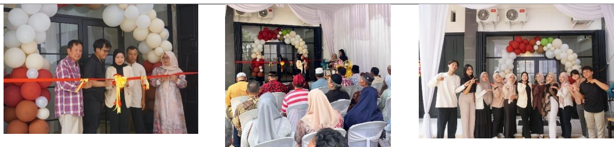
Gambar 2. Grand Opening Gantari Indonesia

Respons masyarakat selama kegiatan berlangsung menunjukkan adanya kebutuhan akan layanan psikologis yang mudah diakses. Sebagian peserta menyampaikan minat untuk mengikuti layanan lanjutan, seperti screening kesehatan mental dan asesmen psikologis, yang mengindikasikan meningkatnya kesadaran ( awareness ) terhadap pentingnya kesehatan mental. Kegiatan Grand Opening ini terbukti mampu membuka ruang diskusi mengenai isu psikologis serta berperan sebagai strategi awal dalam mengurangi stigma dan meningkatkan literasi kesehatan mental masyarakat.