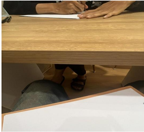
Gambar 6. Asesmen Psikologi

cara individu mengekspresikan diri dan lingkungan, yang melengkapi informasi dari tes tertulis.