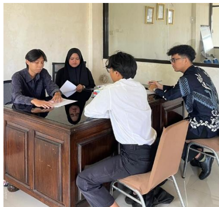
Gambar 5. Asesmen Psikologi

Siti Nuriya Hikma 1 , Fajar Saputra 2 , Hanna Aqeela Humayra 3 , Satria Maulana 4 , Ayu Laksita Utami 5 , Nurwahyuni Nasir 6